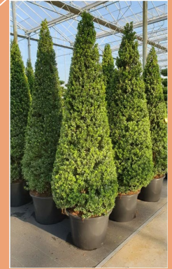
Ilex crenata Maxima