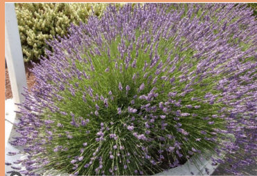
Lavandula intermedia Grosso