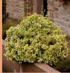
Euonymus fortunei Emerald'n Gold