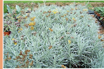
Helichrysum angustifolia Curry