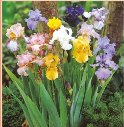
Iris germanica variés