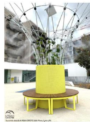
Référence du produit