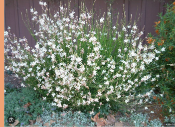
Gaura lindheimeri Geyser White