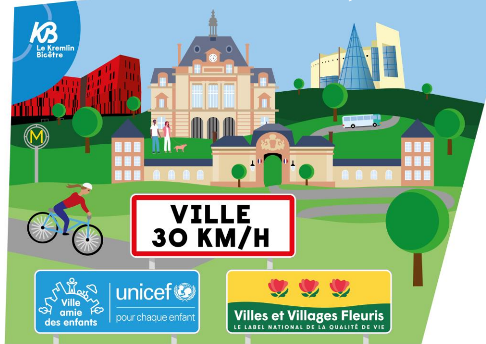
Bâche entrée de ville à partir du 6 octobre