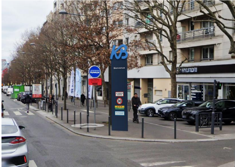
Futurs totems entrée de ville