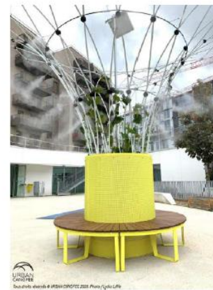
URBAN CONCEPT Des objets, des idées & des idées ORFÈVRE 2008 Référence du produit

Simulation. Attention, cette photo n'est pas contractuelle. Pour une raison de gestion de l'espace public, la municipalité a tranché pour deux canopées.