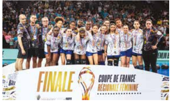
Les handballeuses du CSAKB à la finale de la coupe de France, le 10 juin, à Bercy.