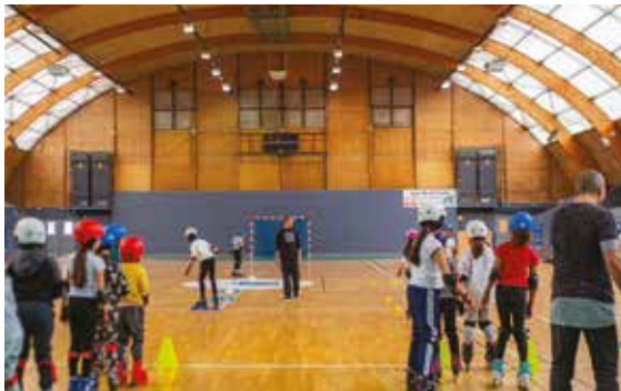
▲ 1 er mars – Gymnase Ducasse