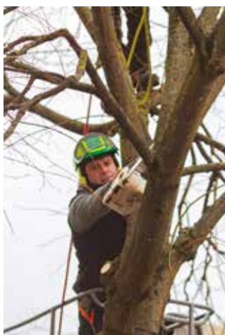
► 11 mars – Parc de Bicêtre