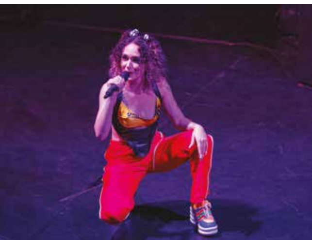
▲ 10 mars - Médiathèque l'Écho

Durant les vacances scolaires, les jeunes Kremlinois de 8 à 12 ans ont profité des « Stages Sport découverte » mis en place par le service des sports de la ville pour s'initier à différentes activités sportives. Au programme, roller et tir à l'arc le matin, mais aussi la découverte d'autres sports sous forme d'ateliers l'après-midi comme la sarbacane, le bowling, la course d'orientation ou encore l'escalade.