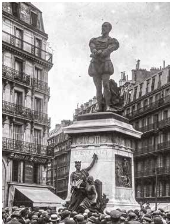
La statue d'Étienne Dolet, place Maubert, à Paris, au début du XX ème siècle.

En 1542, accusé d'hérésie et d'athéisme, il est condamné une première fois à mort par le tribunal ecclésiastique de Lyon. Là encore, une indulgence royale lui sauve la vie. Il fuit un temps en Italie avant d'être repris à Lyon en 1544 pour avoir introduit en France des livres d'inspiration protestante et traduit un dialogue attribué à Platon qui se moque du dogme chrétien de l'immortalité de l'âme. Réfuter l'au-delà ? C'est plus que l'Église ne peut tolérer ! Dénoncé par La Sorbonne, il est ramené à Paris, où il est à nouveau condamné à mort, en 1546. Aucune indulgence royale ne le sauvera cette fois-ci... Il est pendu et brûlé