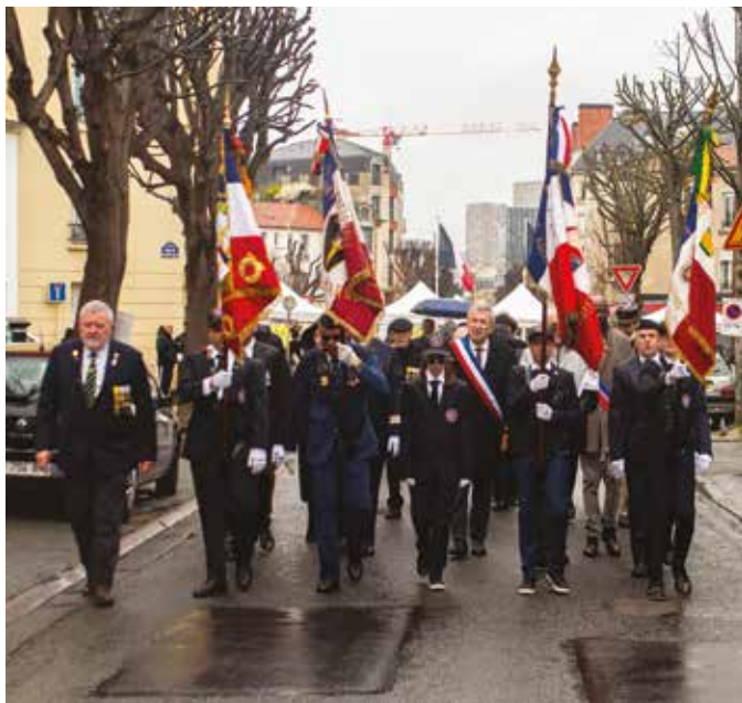
▲ 19 mars – Place des combattants.