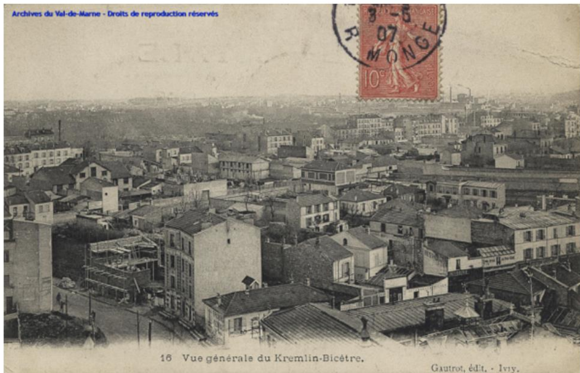
16 Vue générale du Kremlin-Bicêtre.