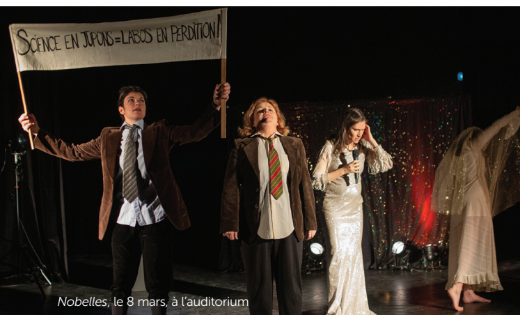
Nobelles, le 8 mars, à l'auditorium